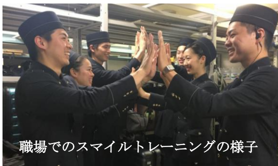
職場でのスマイルトレーニングの様子

訪日外国人のお客が増えるなか、世界100カ国のお客様をお迎えする国際的なシティホテルとして万国共通のおもてなしとなる笑顔の大切さを改めて認識しお客様には勿論、スタッフ同士においてもより円滑にコミュニケーションを図るよう笑顔運動を推進してまいります。