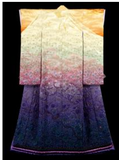
凧(おん) : 春たけなわ、富士の草木も咲き誇る (1995年制作)

作品解説: 富士山シリーズの第一号作品 富士吉田のホテルから観た富士山と樹海を表現した一竹作品の中で最も写實的に表現された作品