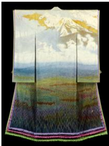
穂(おん) : 霧に嘔ぶ樹海の富士 (1989年制作)

京王プラザホテルでは、ご宿泊の75%を世界100か国以上からお客様をお迎えするホテルとして様々な日本文化をご紹介するイベントを季節ごとに開催しております。新宿は東京から富士山へ向かう起点でもあることから、2013年からは富士山を題材としたフェアを毎年開催し大変ご好評をいただいております。今年「一竹辻が花」を通して日本の文化・芸術に深い影響を与えた富士山の素晴らしさを発信するとともに、国内外で高い評価を得ている染色家久保田一竹氏にスポットをあて、日本の伝統技術の素晴らしさと四季折々の自然の美しさをお楽しみいただけます。