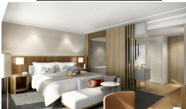
クラブルーム プレミアグラン