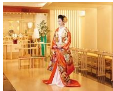
※衣裳着用イメージ